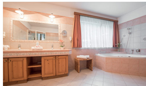
Die große Kutschensuite besitzt im Wohnbad eine Eck-Whirlwanne.