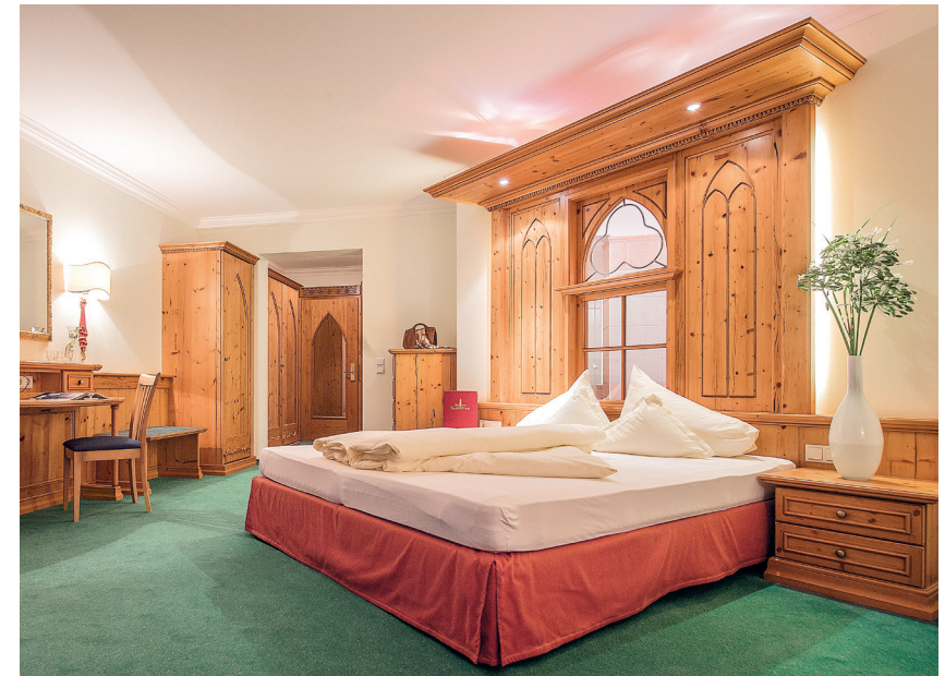
Die großen Betten sind optischer Mittelpunkt der Zimmer und Suiten. Mit der raffinierten Beleuchtung entsteht eine wunderschöne Atmosphäre.