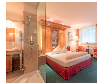
Die Einzelzimmer und die große Kutschensuite verfügen über ein Bad mit raffinierter Vollglas-Panoramadusche mit Blick in den Wohn-Schlafbereich.