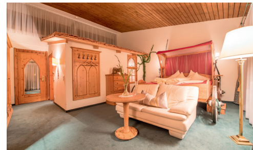
Alle Zimmer und Suiten sind mit viel Liebe zum Detail eingerichtet.